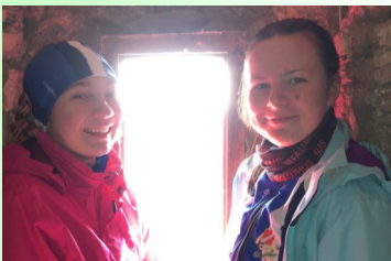
Visst blir väl Liv och My med på Oringen i Kolmården!?

Ett tips är ju att delta i 3-dagars delen och kanske bo där en del av veckan. Kanske kan ungdomarna tälta? Fixa frukost själv och kaka middag på c-orten!?